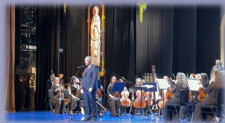
Поздравления золотых юбиляров в Сургутском Дворце Торжеств